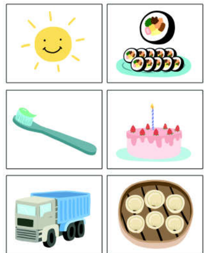
좌측 위로부터 시계방향으로 햇님, 김밥, 케익, 만두, 트럭, 칫솔